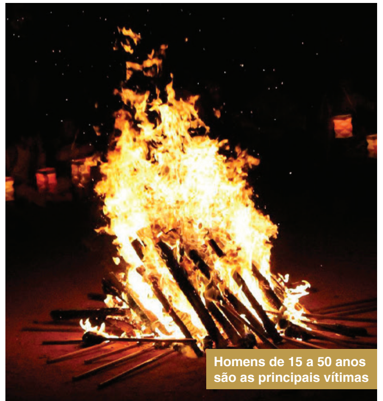
Homens de 15 a 50 anos são as principais vítimas

Segundo grau: quando há comprometimento da epiderme e a camada superficial ou